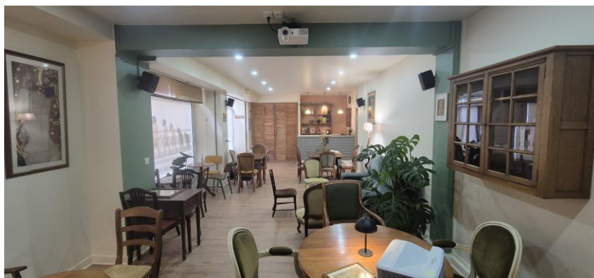
Un nouveau lieu de rencontres : un café culturel et scientifique Sapiens