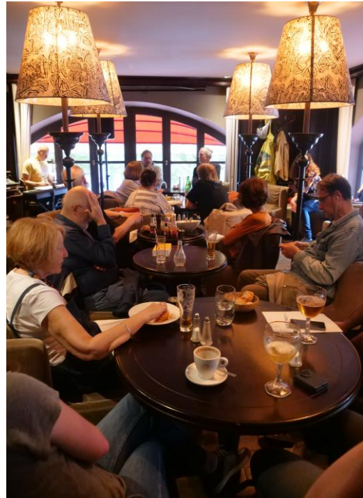
Un public toujours au rendez-vous dans la brasserie Au Vieux Châtelet