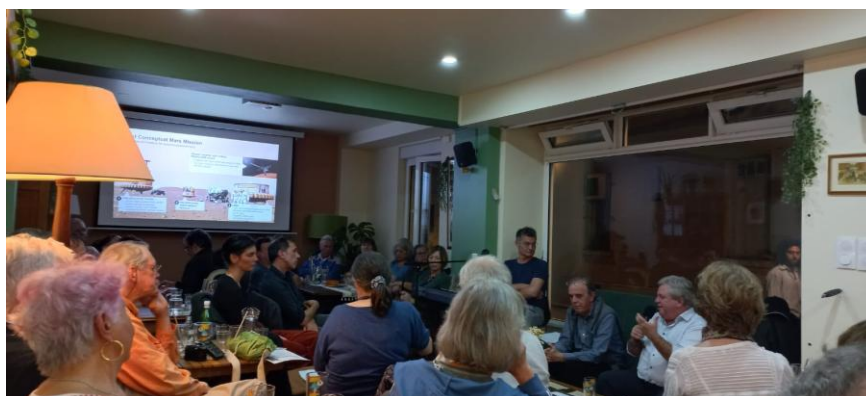
Un public très nombreux pour cette première au café Sapiens